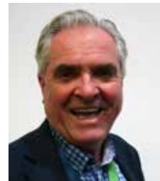
Forbundsleder Yngve Seterås