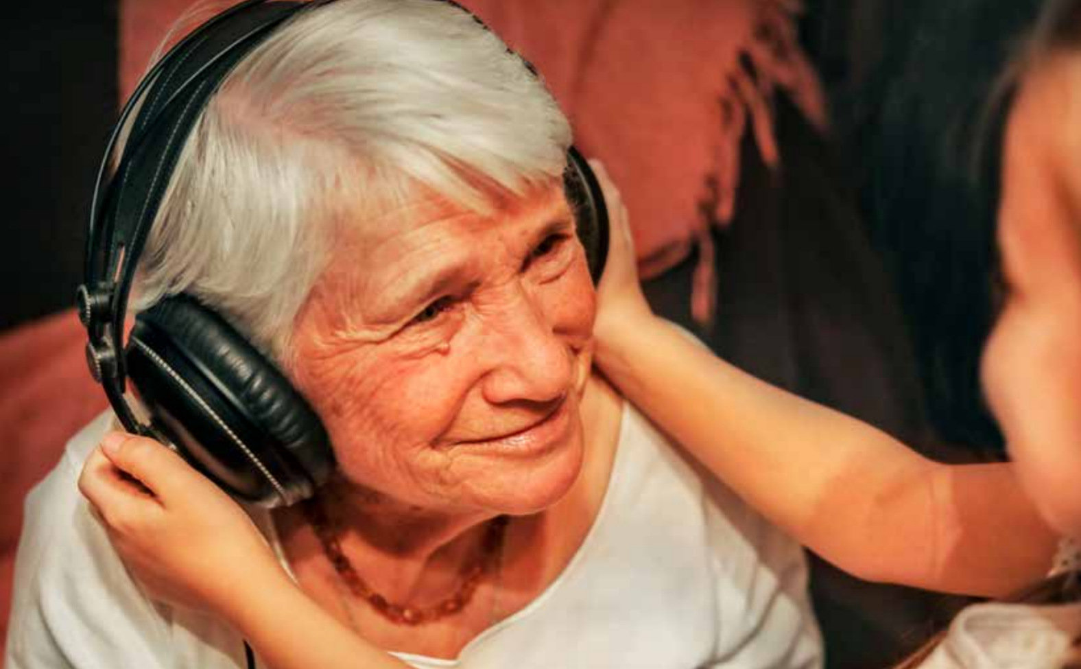
Lyd kan gi tilgang til bøker og informasjon når sykdom gjør det vanskelig å lese.