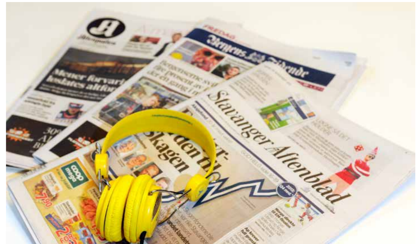
NLB tilbyr lånerne sine aviser og tidsskrifter i lydutgave.

“iPhonen har jeg jo med meg overalt. Jeg hører på lydbøker store deler av dagen - både hjemme, når jeg går tur og i bilen.”