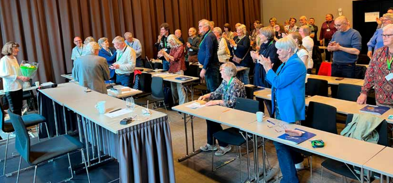
Forsamlingen gir applaus til generalsekretæren for godt arbeid.