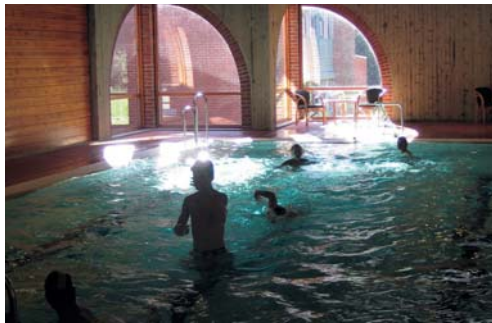
Regelmessig fysisk aktivitet er gunstig.

Mange vil ha nytte av et rehabiliteringsopphold for å komme igang med fysisk aktivitet og en sunnere livsstil. Dette er med på å skape trygghet i hverdagen. Vi bidrar gjerne med informasjon og brosjyre.