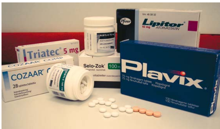
Noen av de vanligste hjertemedisinene

Etter utblokking med stent brukes vanligvis blodfortynnende (blodplatehemmende) behandling med Plavix og Albyl-E tabletter. Platehemmende medisiner gjør blodplatene mindre klebrige, slik at risikoen for blodpropp i stenten blir redusert.