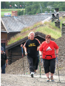
Stavgangsglede fra Sleggveien