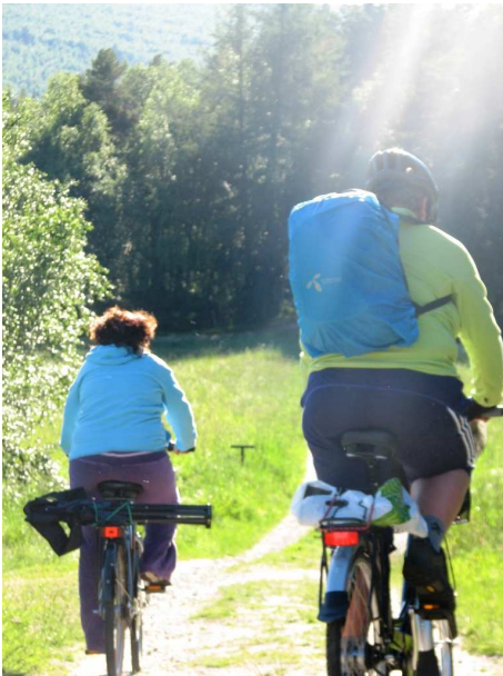
Sykkeltur i Mølmannsdalen

Vi anbefaler alle deltakere å engasjere seg i