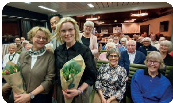
Veldig mange tilhørere på møtet