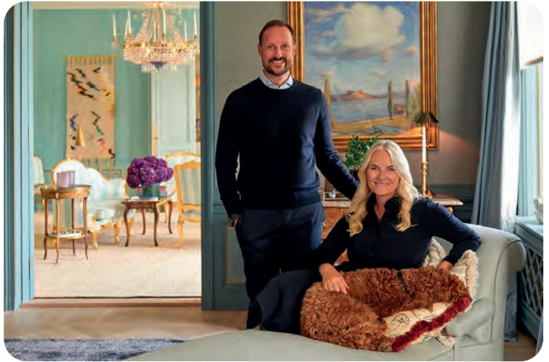
Kronprins Haakon og prinsesse Mette Marit

Som medlem i LHL er du del av et fellesskap, for pasienter, pårørende og andre. Som medlem i LHL er du auto-