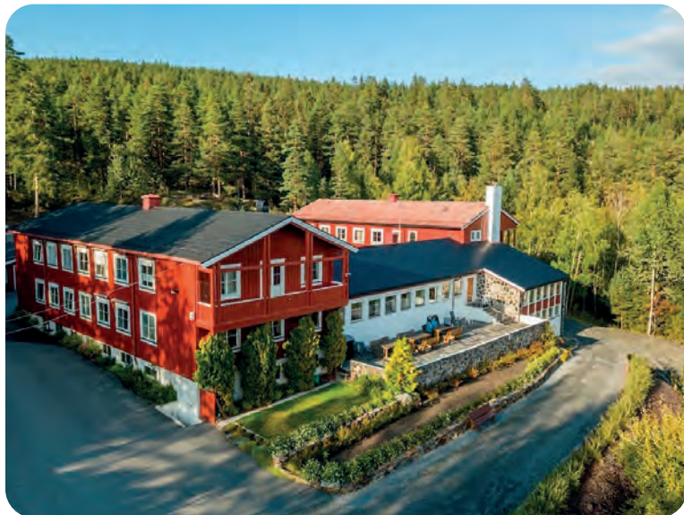
Høyt og fritt i Saggrenda, omgitt av furuskog.

Våren er en krevende tid for mange medlemmer av LHL, og nettsidene våre gir informasjon og gode råd om pollenallergi. Det er i dag stadig bedre medisiner og kunnskap om hvordan forebygge og komme seg gjennom pollensesongen. I tidligere reportasjer har Bladet Vårt skrevet om Geilomo Barnesykehus som driver hele året, men som har mange barn