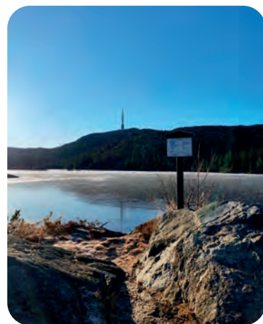
Ved Jonsknuten: Et pollenvennlig område.

En daglig gåtur er en av hjørnesteinene på Fredheim. Gjestene som kommer fra ulike steder i Norge, men også fra